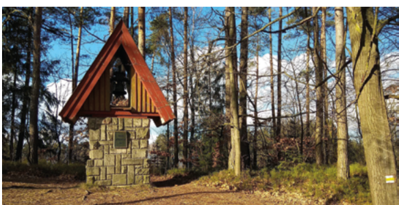
Zvonička na Prachově