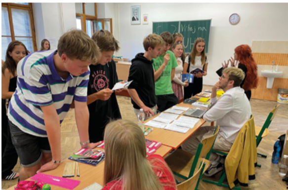
Den vysokých škol na LG

Lepařovo gymnázium spolupracuje s několika vysokými školami. LG je fakultní školou Přírodovědecké fakulty UK v Praze, Farmaceutické fakulty UK v Hradci Králové a také partnerskou školou Univerzity Hradec Králové. Studentky a studenti tak mají možnost navštívit odborná pracoviště vysokých škol a potkat se s odborníky z daných oborů. Uvedené fakulty a univerzity pak mají své zastupení na každoroční akci Den vysokých škol.