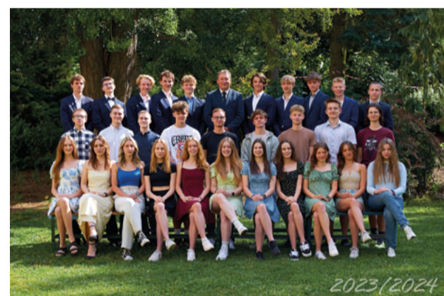
Kvarta (4. C)