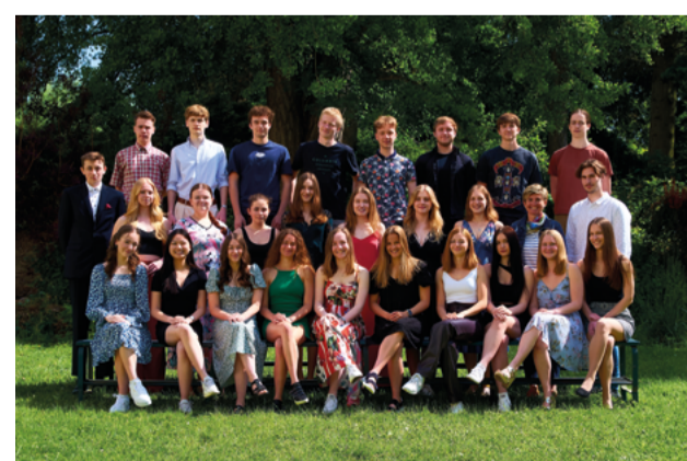
Sexta (6. C)