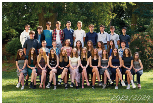
Prima (1. C)