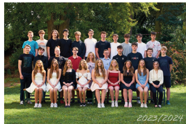
Sekunda (2. C)