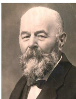
PhDr. Jakub Vsetečka (1850-1931)

Vlastním jménem Antonín Zeman, byl český právník a spisovatel. Jeho dílo týkající se Podkrkonoší se zabývá sociálními problémy a je výrazně ovlivněné myšlenkami socialismu (Blouznivci našich hor, O ševci Matoušovi a jeho přátelích). Syn Kamil Zeman se v literatuře proslavil pod pseudonymem Ivan Olbracht.