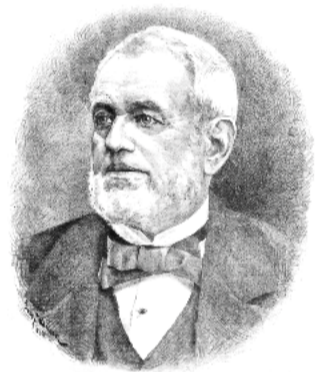
MUDr. Antonín Šlechta (1810-1886)

Český lékař, národní buditel, spisovatel. Aktivně se podílel na revolučních událostech v roce 1848. Byl iniciátorem „lidového“ peněžnictví a díky tomu se na jeho počest český jazyk obohatil o nové slovo „kampelička“, označující družstevní záložny.