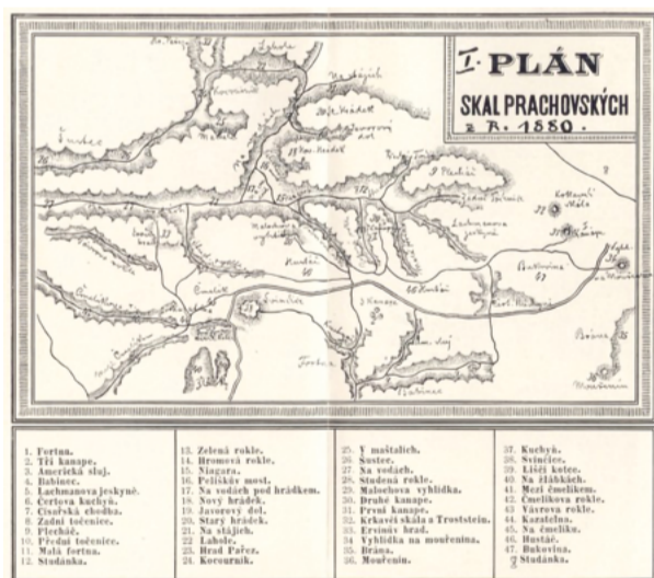
Plán Prachovských skal vydaný roku 1880 studenty Lapařova gymnázia