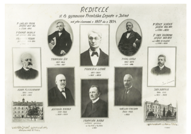
Ředitelé gymnázia od jeho obnovení r. 1807 do r. 1934