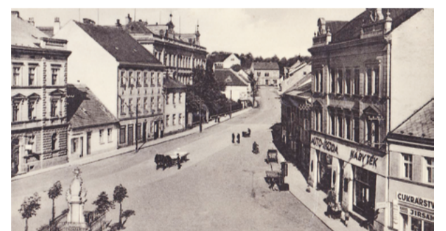
Pohled na LG z Mariánského, dnes Komenského náměstí