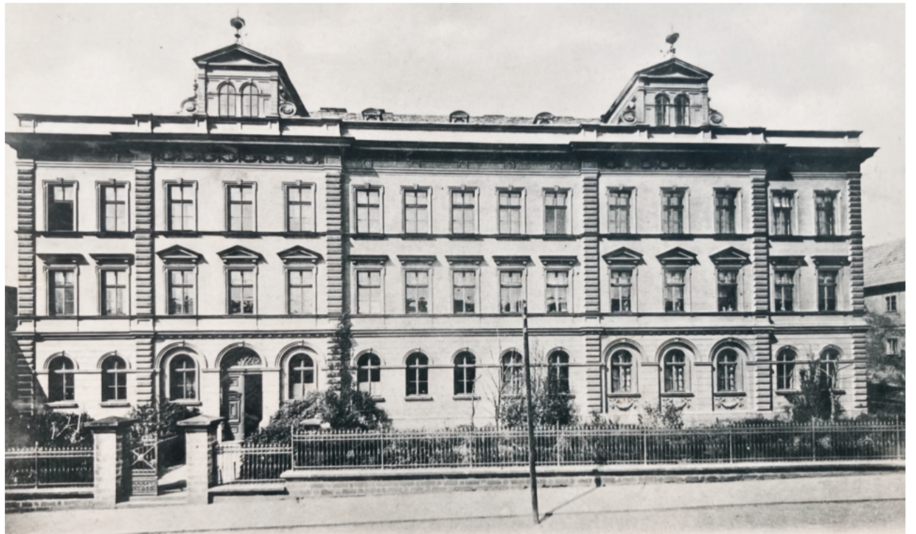
Pohlednice průčelí gymnázia od Josefa Picka (kolem roku 1900)

František Lepař přišel do Jičína z Hané v roce 1856. Byl profesorem latiny a řečtiny, vytvořil dodnes uznávané řecko-německo-české slovníky, na kterých pracoval osm let.