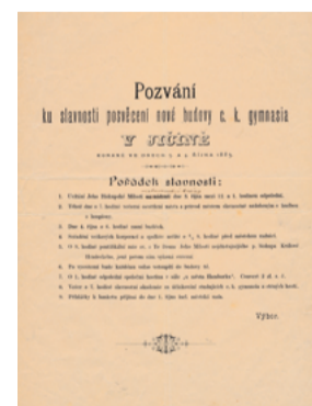
Pozvánka na slavnostní otevření nové budovy gymnázia

Víte, jak dlouho trvala stavba nové budovy gymnázia?