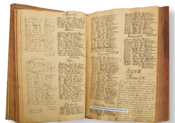
Seznam studentů před zrušením školy

Vedle politických důvodů a nadvlády jezuitů ve školství v celém středoevropském prostoru to mohly být i důvody pedagogické. Jezuitům bylo vytýkáno opomíjení přínosů moderní vědy, absence živých jazyků ve výuce a také pozor: vyučování založené na bezduchem memorování.