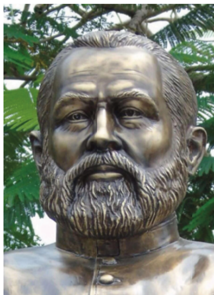
Busta Samuela Fritze v pravděpodobném rodišti v Trutnově

Člen jezuitského řádu, v našem prostředí jen málo známý, byl významný český cestovatel, kartograf a jeden z nejuspěšnějších misionářů Tovaryšstva Ježíšova v Jižní Americe. Proslavil se mj. jako autor první podrobné mapy Amazonky.