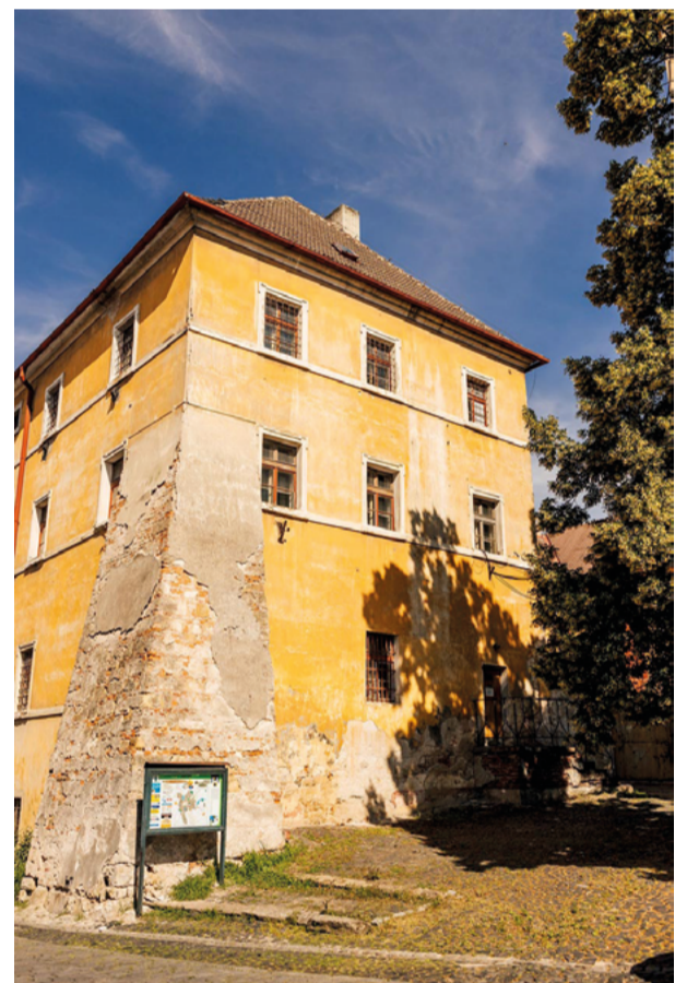
Jezuitská kolej dnes

Historická pohlednice s budovou kostela svatého Ignáce a bývalou budovou jezuitské koleje. Pohled je z 20. let 20. století, kdy budova sloužila již po dlouhou dobu jako vojenská kasárna. Kostel sv. Ignáce dostal své patrocínium (zasvěcení) od zakladatele Tovaryšstva Ježíšova Ignáce z Loyoly. Dříve nesl jméno sv. Jakuba.