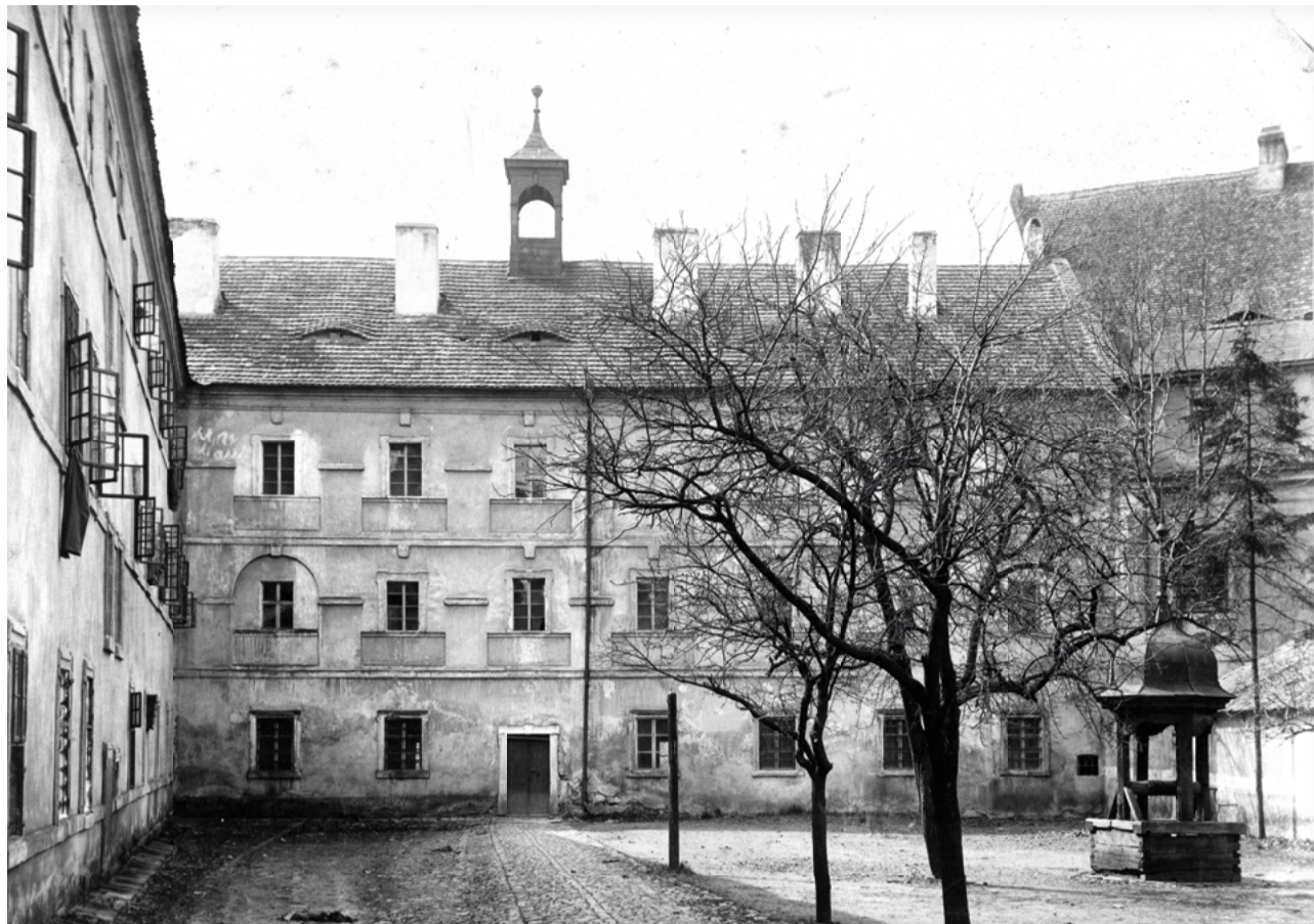
Jezuitská kolej – součást komplexu jezuitských budov, kde bylo původní místo jičínského gymnázia (sbírka RMaG v Jičíně)

Jeden z prvních raně barokních návrhů na fasádu jezuitského semináře v Jičíně (sbírka RMaG v Jičíně)